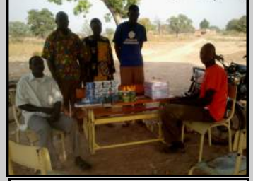
Don par l'APEP à l'école de LATIAN