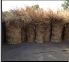
Stock de paille pour construction