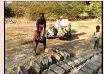
Ramassage des briques