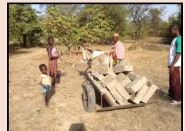
Transport des briques