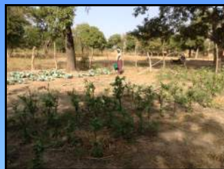
Jardin de maison