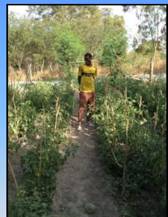
Plants de tomates