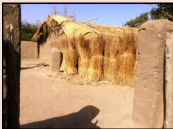
Grange refaite et stock de paille