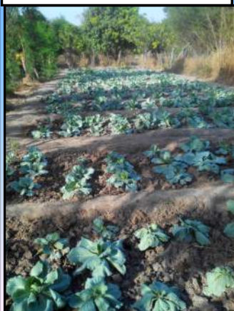
Planche de choux grand jardin