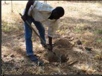
Préparation du reboisement au verger