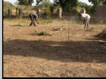
Entretien de la cour