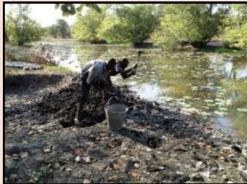
Préparation de la terre pour les briques