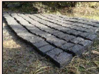
Séchage des Briques