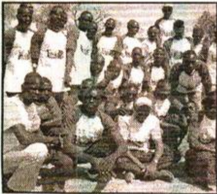
Ce forum a été une occasion de retrouvailles, d'échanges d'expériences et d'acquisition de nouvelles connaissances pour ces anciens élèves.