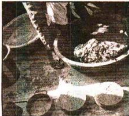
Le processus de fabrication de la pierre à lécher, a été bien enseigné aux participants.