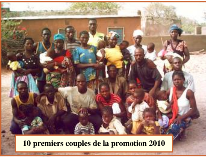
10 premiers couples de la promotion 2010