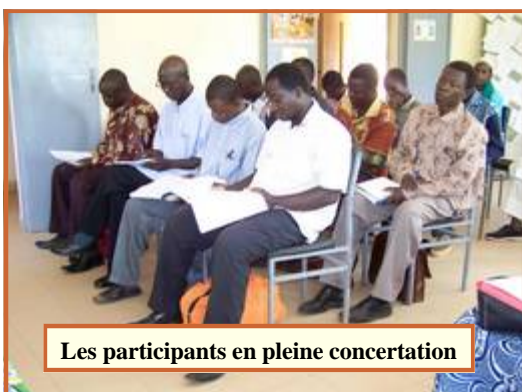
Les participants en pleine concertation

Les documents seront finalisés dans les prochaines semaines pour contribuer aux réflexions nationales sur la formation et le renforcement des capacités des producteurs. Ils seront transmis au comité de pilotage de la SNFAR (Stratégie Nationale de Formation Agricole et Rurale) mis en place en juillet 2009 et chargé de vulgariser début 2011 un document cadre sur la formation agricole de masse au Burkina Faso.